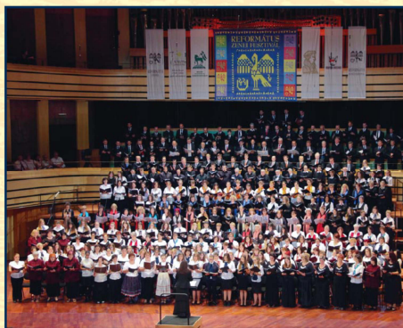
A felvétel a XV. Református Zenei Fesztiválon készült a MŰPA Bartók Béla Nemzeti Hangversenyteremben, 2018. július 7-én.