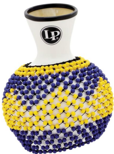
18. kép: LP484