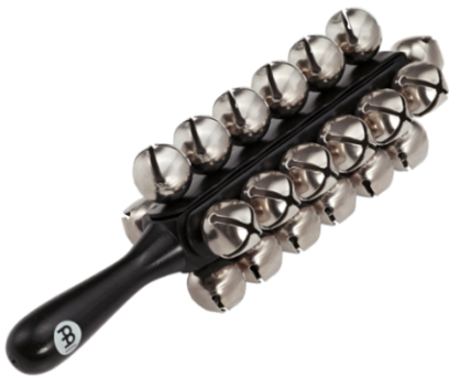
22. kép: Meinel Sleigh Bells (SLB25)

Talán sokan a karácsonyra asszociálnak a hangja hallatán. Azonban a hangszer ennél sokkal többet is jelent. Jellegetes hangját a gömb alakra hajtogatott fémlemez, és a belsejében elhelyezkedő szabadon mozgó fémgolyó adja.