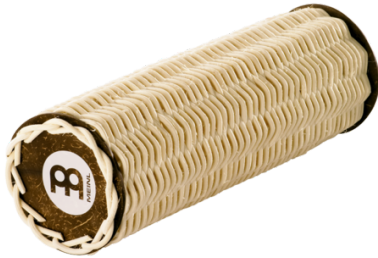
9. kép: Meisl GA2

Brazil eredetű, henger alakú hangszer. A samba egyik alap hangszere. Nádból fonják, az alja kókuszából, vagy műanyagból, vagy valamilyen más kemény lapból készül.