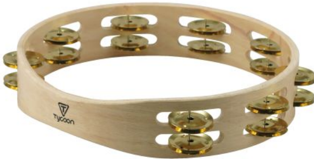
23. kép: Tycoon Double Row Wooden Tambourine With Brass Jingles (TBW-10D BB)

A csörgődobhoz hasonló, de nincs membránja, sokszor össze is tévesztik őket. Van kézi, és állványra szerelhető változata is. Közeli hasonlóság a rocar-ral (chocalhos), és sistrum-mal van. Azonban a keretes dobok családjával van szorosabb rokoni kapcsolatban (ezekről majd egy másik alkalommal talán bővebben), feltehetően az arab, közel-keleti ütőhangszerekkel.