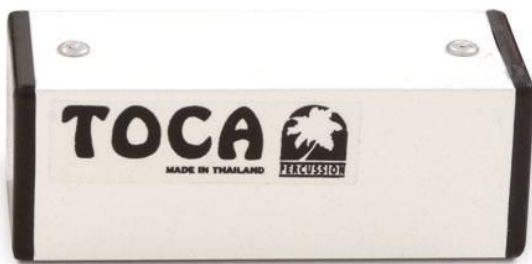
8. kép: Toca T-2204

Idiofon (közvetetten idiofon) ütőhangszer, számos méretű és formájú hangszer tartozik ehhez a csoporthoz. Minden oldalán zárt cső, vagy doboz, amely magvakkal, kavicsokkal, gyöngyökkel, terméssel, vagy újabban műanyag granulátummal van töltve. Nevét az angol „shake” – rázni igéből kapta, a megszólaltatás módja miatt.