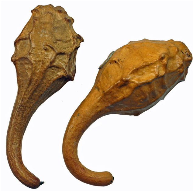
5. kép: egy pár Hosho

Kashaka: Vagy más néven Cas Cas. Két kis méretű shaker egy kis kötéllal összekötve. Az egyiket a tenyerében tartja a játékos, a másikat pedig a kötéllal segítségével akörül pörgeti. Amikor a két shaker összeér, jellegzetes koccanó hangot ad. Általában párban használják, nyugat-afrikai eredetű.