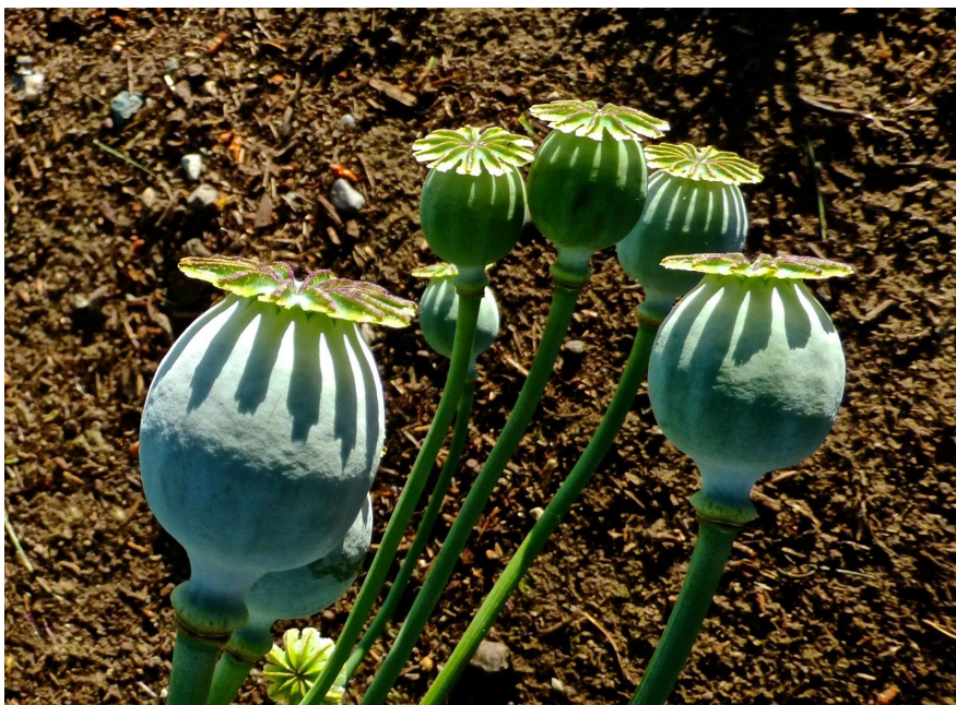
2. kép: mákgubó