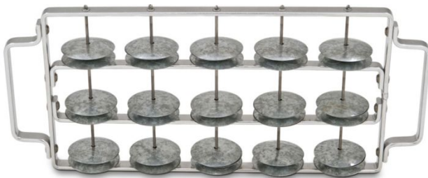
14. kép: LP3602

A Chocalhos, vagy más néven Rocar a samba egyik alap hangszere. Egy keretbe nagyobb pénzérme méretű alumínium csörgőket rögzítenek. A pontos játék gyakorlottságot, odafigyelést igényel, hangja igen erős.