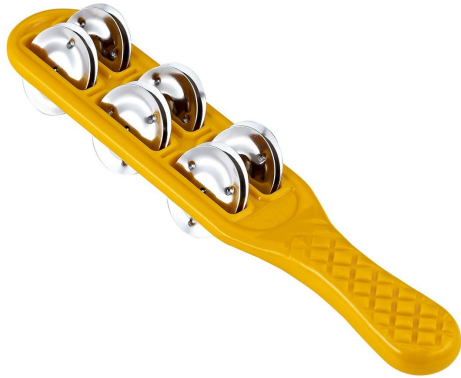
4. kép: Nino Jingle Stick

Talán nem csak bennem merült már fel az a gondolat, hogy formában, hangzásban is tovább él zenekultúránkban a sistrum: