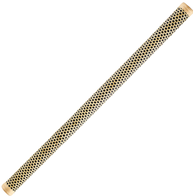
19. kép: Meinel PRORS1-XL

Az esóbot (rainstick) feltehetőleg dél-amerikai eredetű, feltehetően chile-i hangszer. A test hosszú csőszerű, belül üreges és apró gyöngyökkel, magvakkal van töltve. A sajátossága, hogy a cső belsejében egy spirál található, és ennek mentén apró tüskék van elhelyezve. Emiatt a töltelék lassan csorog le a cső aljára, a hangszer belsejében pedig létrejön az esőre