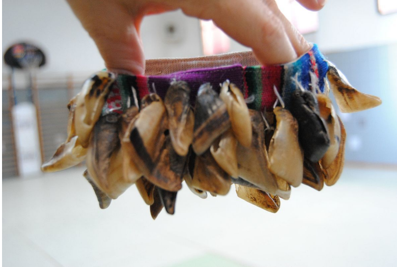
7. kép: Chajchas

iben használják (például: Kolumbia, Bolívia, Peru, Chile, Ecuador). Itthon az ütőhangszeresek körében használatos fogalom a kecskeköröm kifejezés, azt hiszem ez pontosan az. Ez viszont már nem egészen a természetben talált shaker, ez már ember által készített.