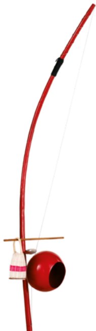
11. kép: Meinel BE1R

A caxixis egyébként a berimbau hangszer egyik kelléke (is), amit a capoeira kísérőjeként használnak. Egyik kézzel az íjat kell tartani, és a húrt szabályozni, a másikkal ütni, és a caxixis-t rázni. A tök rezonátort a hashoz illesztve, illetve elvéve (mozgatással) idézhető elő a „wah-wah” effekt.