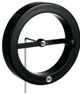
20. kép: Meinl RA7BK

A Meinl gyár (is) készített végtelenített, jelen esetben kör alakú változatot. Hangja a monszunesőre emlékeztet.