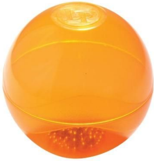
16. kép: LP443