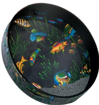
21. kép: 12" Remo Fish Graphic Ocean Drum