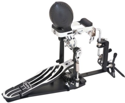
17. kép: LP Fusheki Pedal Bracket with Maraca

A 17. képen egy maracas látható, pedálra szerelve. A lábkolomp után egyre inkább nyílik az út a láb használata felé, kilépve a megszokott lábdob-lábcin szerepkörből.