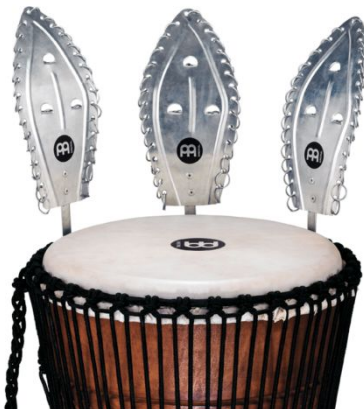
24. kép: Meinl KES-01