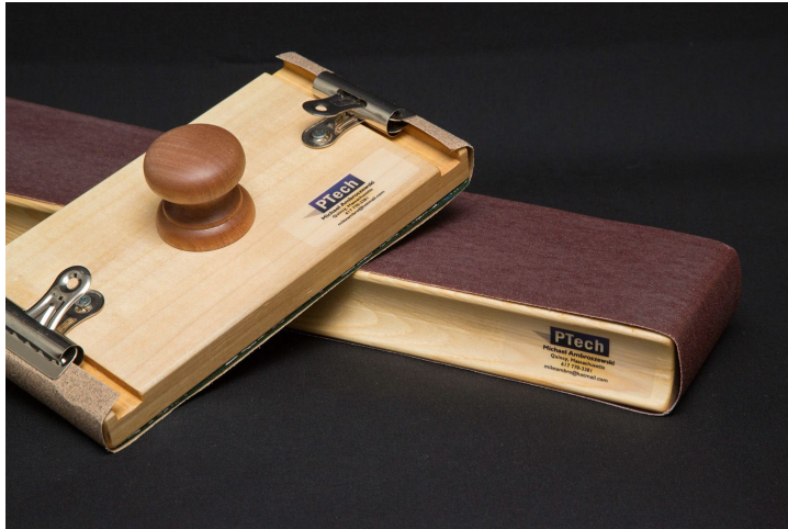
25. kép: P-Tech Sandpaper blocks

Ebben a csoportban kakuktkojás, hiszen ez egy dörzsölős hangszer. Tágabban értelmezve a „csiszoló papír tömb” mégis idesorolható, mert hangja a shaker-re emlékeztet. Megszólaltatásakor két egyforma testet dörzsölünk össze. Egészen pontos, konkrét ritmusokat is lehet játszani rajta, főleg a dobseprű elterjedése előtt volt gyakran használatos. Felépítése: két fadarabot, vagy simító lapot csiszolóvászonnal borítunk be.