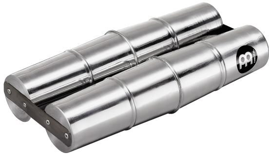
13. kép: Meinl SSH2-L

A Samba shaker a brazil karneválok hangszere. A test alumíniumból készül, és a hangja éles, igen erős, utcai használatra van tervezve.