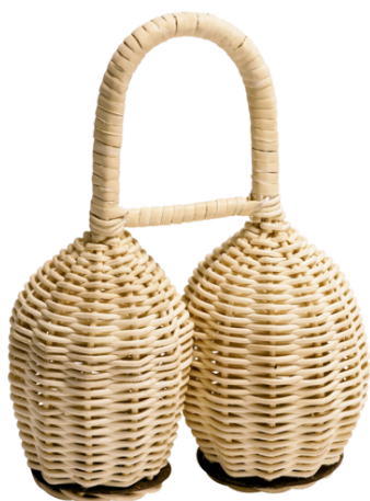
12. kép: Meinel D01

A caxixis egyébként a berimbau hangszer egyik kelléke (is), amit a capoeira kísérőjeként használnak. Egyik kézzel az íjat kell tartani, és a húrt szabályozni, a másikkal ütni, és a caxixis-t rázni. A tök rezonátort a hashoz illesztve, illetve elvéve (mozgatással) idézhető elő a „wah-wah” effekt.