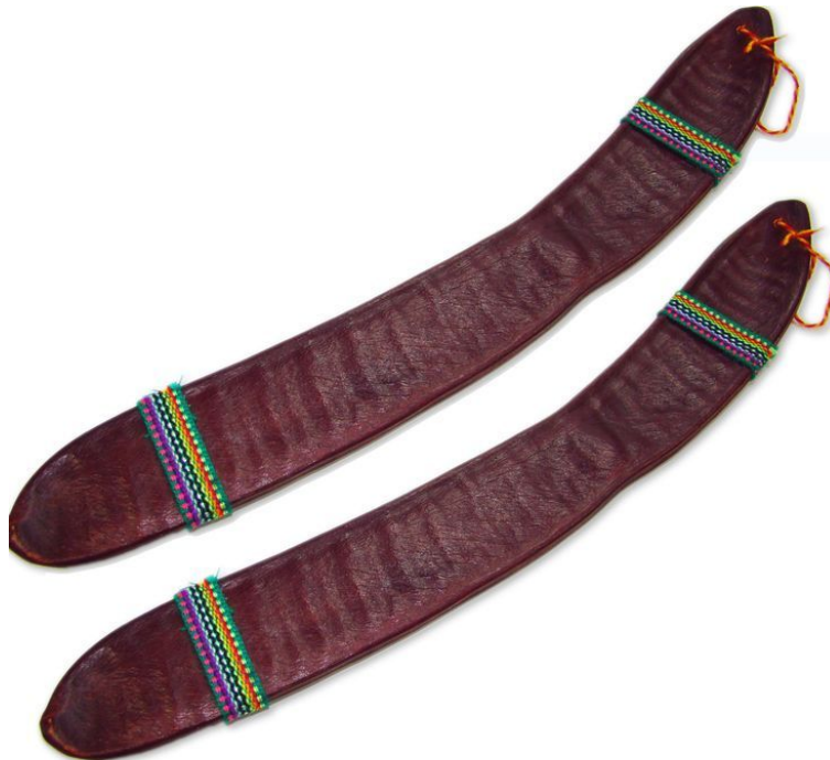
1. kép: Pod Rattles

Hangszerelemző sorozatom 6. részében egy igen népes percussion hangszercsaláddal, a rázással megszólaltathatóakkal fogok foglalkozni. Több latin-amerikai kontinensről származó hangszer tartozik ide, többségük afrikai gyökerű. Tehát a sorozatom utolsó cikkében a „rázós” hangszerek kerülnek nagyító alá.