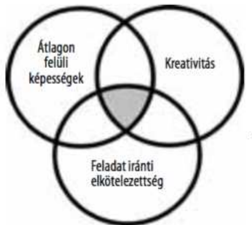
1. ábra Renzulli 3 körös tehetségkonceptiója

Renzulli szerint, ha ezek közül csak egy vagy kettő van egyszerre jelen az nem jelenti azt, hogy tehetséges valaki. Mind a 3 komponensnek egyszerre jelen kell lenni. Ebből adódik, hogy az intelligencia önmagában még nem ad okot arra, hogy valaki tehetségesnek legyen nevezhető. Ezt mutatja az első ábra.