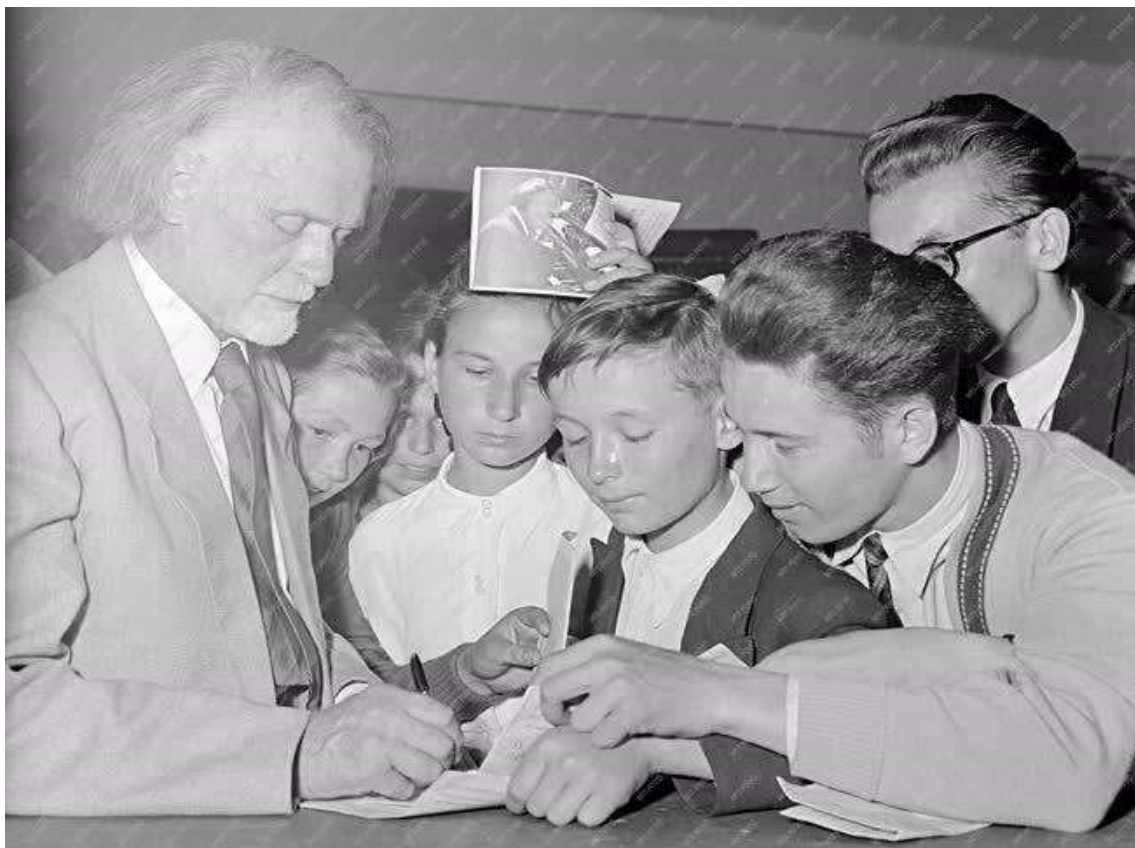
Debrecen, 1957. június 23. Kodály Zoltán autogramot ad a debreceni Kodály Zoltán Zeneművészeti Szakiskola Kodály-estje előtt az Aranybika koncertterme előterében, a hajdúsági zenei héten