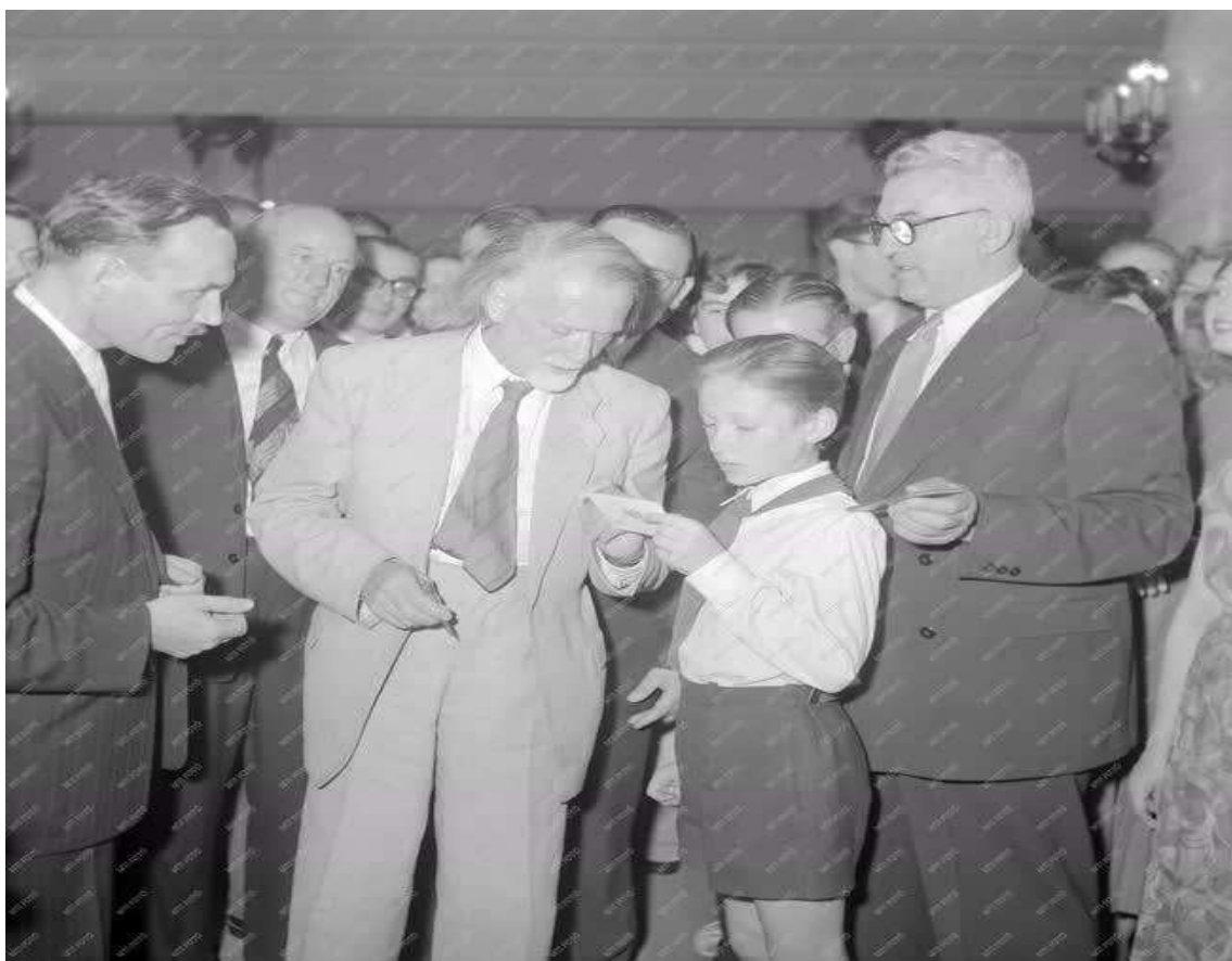
Debrecen, 1957. június 23. Kodály Zoltán, autogramot ad Kodály Zoltán Zeneművészeti Szakiskola Kodály-estje előtt a helyszínen (Arany Bika Szálló Konferterme)