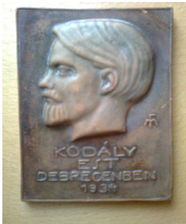
Medgyessy Ferenc terrakottából készült plakettje az iskola tulajdona

1934-ben a haladó szellemű Ady társaság meghívására jött Debrecenbe a Mester Népzene és Műzene címmel előadást tartani. A Kodály-est az Aranybikában zajlott, frenetikus sikerrel. Erre az alkalomra készítette városunk szülötte a neves szobrász Medgyessy Ferenc (Debrecen, 1881. – Budapest, 1958.) kétszeres Kossuth-díjas szobrászművész, kiváló művész) Kodály fejét ábrázoló plakettjét, amelyet 1500 példányban sokszorosítottak: ez volt az estre a belépő.