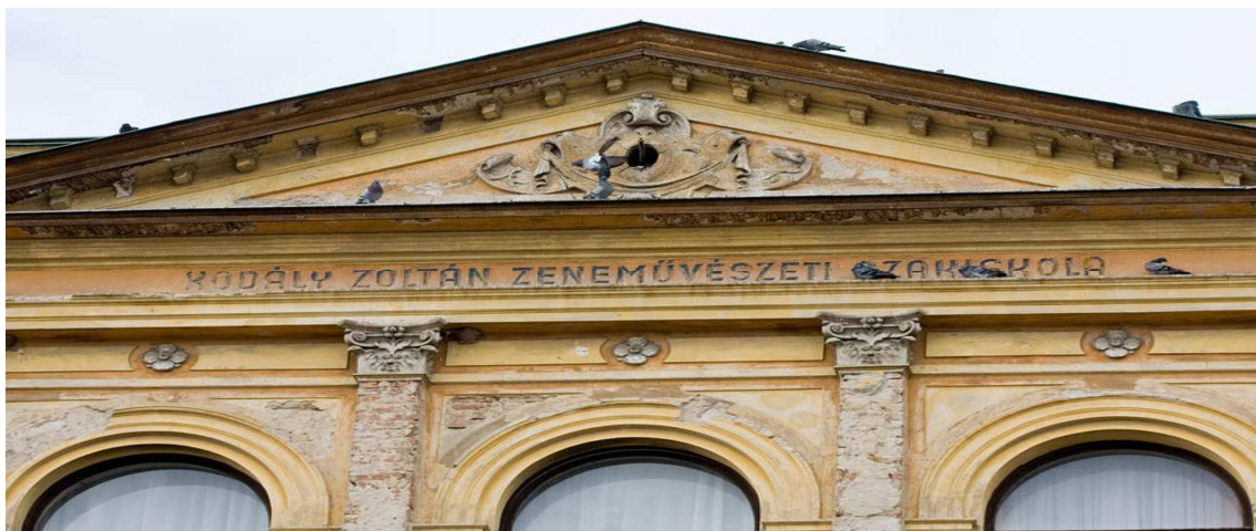
1957. június 23-án a névadáskor, a homlokzatra került felirat