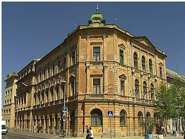
Zenepalota, Debrecen 2018

A debreceni szakiskola jövője: példát adni a szolfézs és hangszertanítás összehangolására, ének alapon történő hangszertanítással új énekekre bírni a hangszereket; a környékre kisugárzó működéssel hangzó életre bírni a néma berkeket.”(Kodály Zoltán, Debrecen, 1957. június.23.)