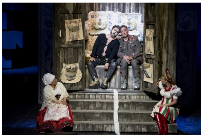
A négy főszereplő a „budi” – jelenetben