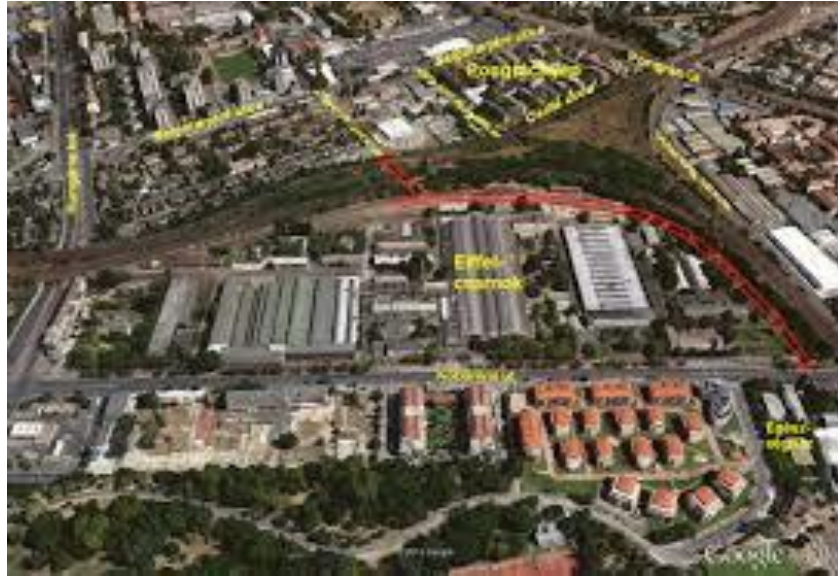
Az ország egyik legnagyobb színpadának épületegyüttese madártávlatból