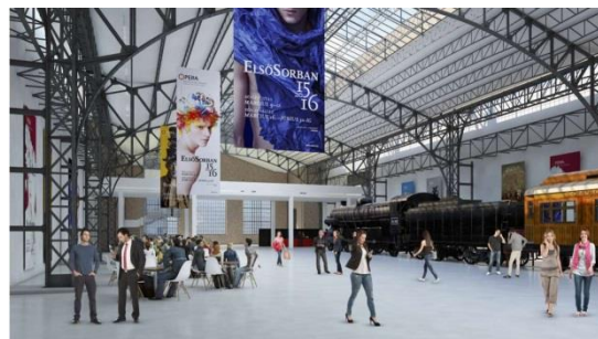
Az Északi Járműjavító és egy 301-es gőzmozdony az átépítés kezdetekor és most

Érdekes, hangulatos új művészeti helyszínt alakított ki a felújítás alatt álló Operaház az egykori Északi Járműjavítóban. A Kőbányai úton álló, évek óta használaton kívül álló üzemcsarnokot voltaképp alig kellett átalakítani: az