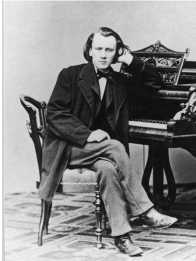
Johannes Brahms

Johannes Brahmsot (1833-1897) ugyanúgy, mint Beethovent vagy Bartókot a nagyközönség jobbra zeneszerzőként ismeri, pedig mindhárman ragyogó, virtuóz zongoristák, egyéni jellegzetességgel bíró előadóművészek is voltak.