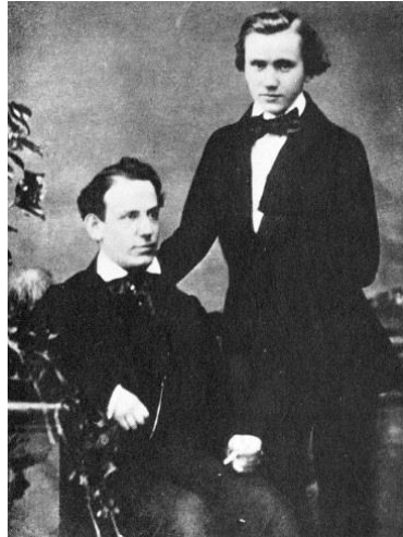
Reményi Ede és J. Brahms 1852-ben

Virtuozitása 20 éves korában vált Európa szerte ismertté, amikor a magyar hegedűssel, Reményi Edével turnézott. Egyik hangversenyükön a zongora fél hanggal alacsonyabb volt, és Brahms a legnagyobb természetességgel transzponálta az összes kíséretet (köztük Beethoven c-moll szonátáját) fél hanggal feljebb.