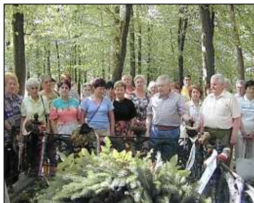
Kazinczy Ferenc sírjánál Széphalmon

helyét jelölő, Kiss György alkotta rézdombormű elhelyezésében. Az Erkel Ferenc Társaság, valamint elnöke részéről igazán nemes, önzetlen, patrióta gondolat volt, amit a zempléni zeneszeretők hálás szívvel fogadtak. Azt a patikát kereste professzor úr, ahol az életrajzi források szerint a verbunkos-szerző végórát élte. A részletek megbeszélésére a fővárosban volt első