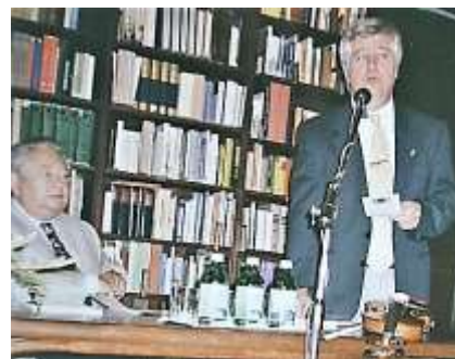
Az első előadás 2001-ben

Szerencsésnek és egyben különösnek is mondható a magyar zenei romantika két csillagának – a verbunkos zenei stílus kialakítójának, valamint felvirágoztatójának – állása, amikor 1989-ben, egymástól mintegy 200 km távolságban lévő városokban ügyszerető szakemberek, lelkes lokálpatrióták szegletkövet raktak le: Gyulán Erkel Ferencnek, Sátoraljaújhelyen Lavotta Jánosnak. Erkel szülővárosában Dr. Bónis Ferenc zenetörténész elnökletével egyesület jött létre, Zemplén fővárosában az állami zeneiskola igazgatójának kezdeményezésére ugyanekkor vette fel a Tállyán nyugvó verbunkos-szerző, hegedűvirtuóz, a magyar színjátszás első karmestere, házitanító nevét, jött létre a Lavotta János Kamarazenekar, valamint a szervezeti háttérrel biztosító Lavotta Alapítvány. A két, addig egymástól külön futó kezdeményezés a millennium évében egy váratlan telefonhívással egyszer csak összekapcsolódott: Bónis Ferenc vagyok... Véleményt kért, az Erkel Ferenc Társaság kezdeményezésére Tállyán, Lavotta utolsó tartózkodási