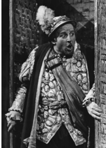
Falstaff (Falstaff, 1992)

„Falstaff!” Mikor első próbán beültem abba a széles, rusztikus székbe, megrettentem, mert megéreztem a szerep hatalmasságát is. Az Otello „Jago-”t is szeretem, bár kritikusaim számon kérik tőlem a figura démoniságát. Megtéveszti őket nyílt tekintetem, vidám természetem. De hiszen épp azt kell elhitetnem, hogy a világ legjámborabb-nyájasabb embere vagyok. Ha be akarom csapni környezetemet, színlelnem kell. Kétszer marad Jago egyedül a színen, csak akkor nyilatkozik meg leplezetlenül, a Credóban és mikor az ájult Otello-hoz szól: „Ki tiltja meg, hogy sarkammal e fekete arcba lépjek?”