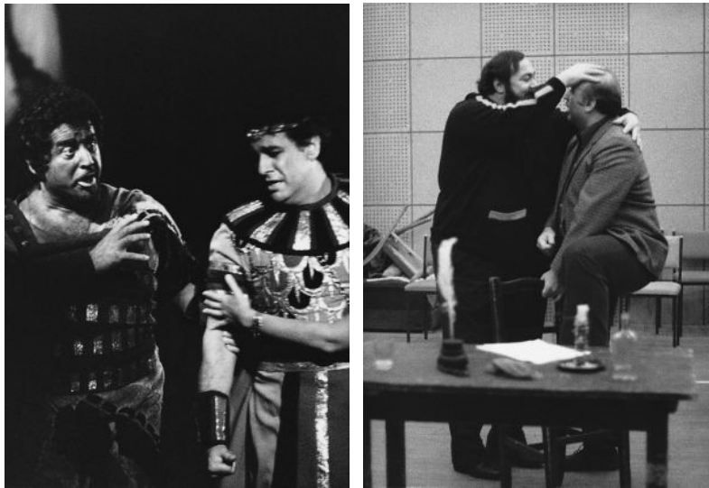
Plácido Domingóval az Aidában és a Bohémélet próbáján Luciano Pavarottival

utasítanom, mert az Opera nem engedett el. Többek között egy Richard Strauss „Salome” előadásra tűztek ki Rysanek-kel. San Francisco pedig a MET ugródeszkája. Ez a két egymás utáni visszautasítás nem használt nekem. Akkor még fiatal voltam, engedelmeskedtem vezetőimnek, nem csapkodtam, lehet, hogy ma másképp döntenék. Később Rennert hívott „Az álarcosbál” Renére. „Szó se lehet róla” – válaszoltam. „És Verdi: „Traviata” Germont? „Nem!” „Jago, vagy Scarpia”. Hamarosan szerződési ajánlat érkezett 8 Germon-ra. Egy előadás háromezer DM. Ennyi pénz egy kezdőnek és Münchenben! Újra kihagyjak valamit? Igent mondtam.