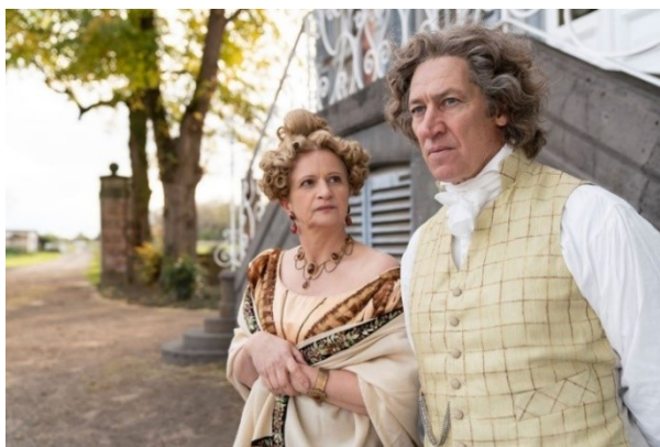
Tobias Moretti Beethovenként és Johanna Gastdorf, mint sógornő, Therese a „Louis von Beethoven” -ben.

2020 karácsonyának első napján mutatta be a német ARD csatorna Nikki Stein Louis van Beethoven című (ez az inkább Ludwig néven ismert unoka apai nagyapjának neve!) filmjét, a Beethoven év valóban méltó lezárásául. Előzőleg egy hosszú és szórakoztató interjú – Rainer Unruh írása – jelent meg a TV Spielfilm című műsorújságban, egy beszélgetés Tobias Morettivel , aki a filmben az idős Beethoven indulatokkal, feszültségekkel, testi és lelki fájdalomokkal teli alakját testesítette meg, míg a tizenhárom esztendőes Colin Pütz a majdnem-csodagyereket, Anselm Bresgott pedig az ígéretes, de zabolátlan fiatal komponistát.