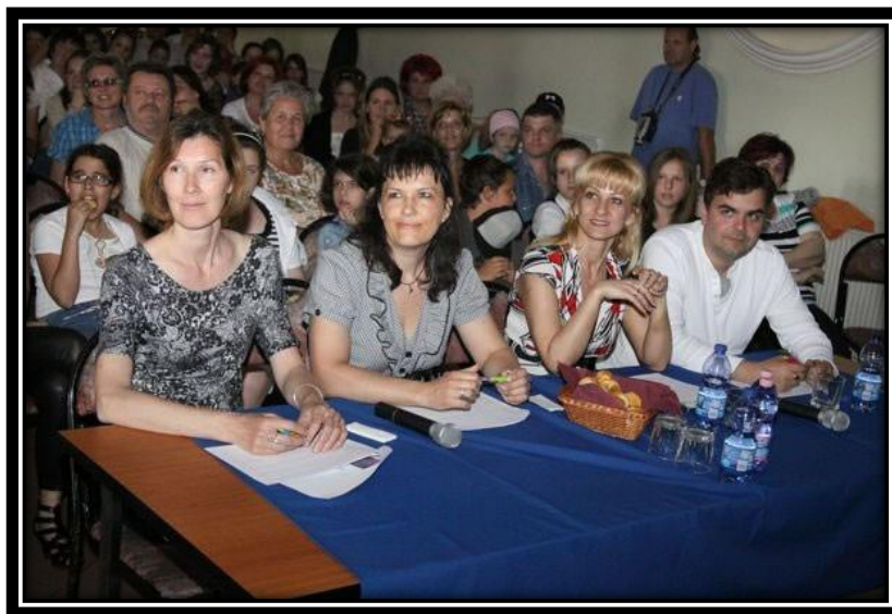
A zsűrizés egyik legszebb pillanata 13