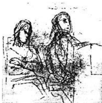
Delacroix előzetes vázlata, most a Louvre -ban, a közös portréhoz. George Sand (1804-1876) varr (ez volt a kedvenc tevékenysége), miközben Chopin zongorázik. A kettős portré 1838-

Chopin 1831-ben érkezett Párizsba, élete hátralevő részét túlnyomóan itt töltötte. Apja francia származású volt, anyja lengyel. Chopin lengyel származását mindig is büszkén vállalta, és hazafisága mindig is megmaradt. Nemcsak zongoristaként, hanem zseniális alkotóként is számom tartották és jelenleg is így tartjuk. Új játékmódot képviselt, megmutatkozott bátor és kifinomult harmónia érzéke. Természetes technikai adottságokkal és könnyed stílussal rendelkezett. „Ágyú, virágokkal borítva” mondta róla Schumann. Liszt is csodálta Chopin zongoratudását. Dalolnak az ujjai, mondta állítólag. Chopinnek szinte valamennyi művét műsoron tartják. Elkötelezte magát a zongorához. Komponált keringőket, mazurkákat, etűdöket, polonézeket, noktürnöket, fantáziákat, balladát, variációkat, szonátát, versenyműveket. Zongorajátéka sokszor lélegzetelállító, szikrázó, tündökletes, amint a bonyolult alakzatokat kibontja, és úgy teríti szét a billentyűsoron, hogy az egyes hangok apró csillagfényként vándorolnak rajta, írta Schönberg. Játéka sohasem volt hatásvadász, vagy közönséges. Új stílust teremtett. Mélyreható változásokat hozott a jövő zenéjébe. Aprólékosan kidolgozott, a végsőkig sűrített zenét írt, amelyben sokszor csupán egyetlen zenei gondolatot bont ki.