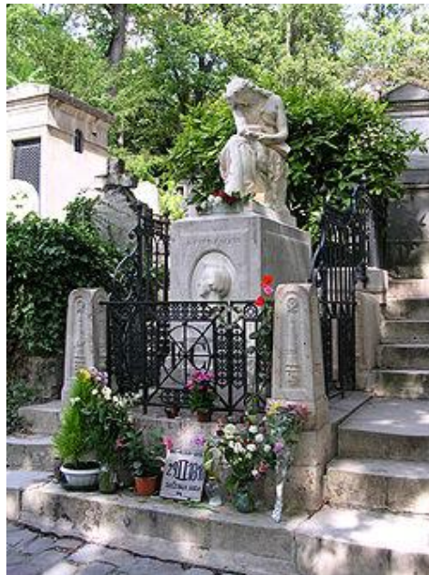
Chopin síremléke párizsi Père-Lachaise temetőben

Chopint a párizsi Père-Lachaise temetőben helyezték végső nyugalomra. Kívánságára Mozart Requiemjét játszották a temetésén. Síremlékét közadakozásból és barátainak a felajánlásaiból emelték. Szívét és leveleit a varsói Szent Kereszt templom egyik oszlopában őrzik.