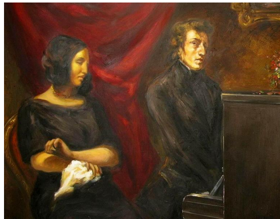
Eugène Delacroix: Fryderyc Chopin és George Sand portréjának modern hipotetikus rekonstrukciója

G. Sand (Ordrupgaard Múzeum, Koppenhága és Fr. Chopin (Louvre, Párizs)