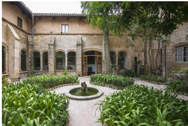
A mallorcai karthauzi kolostor belső kertje

Mallorca szigetén található az a valldemossai karthauzi kolostor, ahol 1838–39 telén több hetet töltött Chopin, valamint George Sand, a regényíró, két gyermekével.