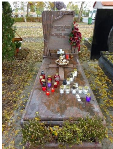
Gregor József (1940–2006) sírhelye a szegedi Belvárosi temetőben

Most, amikor ezt a kis visszaemlékezést érlelgettem magamban, a felejthetetlen Gregor Józseffel – Jóskaival – kapcsolatos emlékeim előhívásához segítségül hívtam a YouTube gazdag Gregor-kincsestárát is. Ebben az egyik drágakő az a néhány felvétel, amely a „Hegedűs a háztetőn” zsidó tejesembere, Tevje szerepében szólítja vissza közénk Őt. Emlékezetesek többek között azok a pillanatok, amikor a szegény anatevkai családapa a hagyományok fontosságáról énekel.