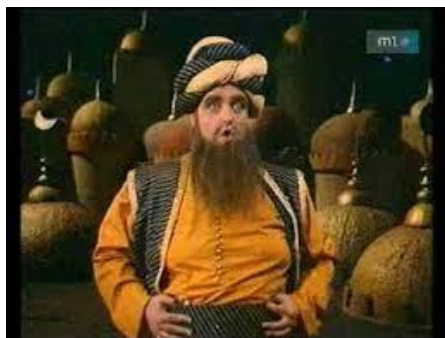
Ozmin's aria JÓZSEF GREGOR Ha! Will ich triumphieren (sung in Hungarian) (4:02)

TV Zenés Színháza. Rendezte: Szinetetár Miklós (1980)