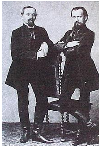
Doppler Ferenc és Károly (Wikipédia)

hogy azonnal első fuvolistának szerződtek. Önéletrajza szerint annyira boldog volt a pesti Nemzeti Színházban, hogy évekre szólóan abbahagyta a koncertezést. 1842 áprilisában megnősült, és úgy érezte, hogy végre feladatot kapott: egy új közönség számított a munkásságára. Hogy ne érezhette volna itthon magát ebben a városban: Pest-Buda ekkor vált Magyarország szellemi központjává! Az 1810-es évek óta színvonalas kamarazene társaságok működtek itt, 1818 óta szervezett koncerteket a Schedius-féle első Pesti Zeneegyesület, 1829 óta Bartay András és Menner Lajos Pestvárosi Énekiskolája, 1836-ban a Pest-budai Hangászegyesület, 1837-ben a Magyar Nemzeti Színház, 1840-ben a Nemzeti Zenede nyitotta meg a kapuit. Ezek az évek jelentették a verbunkoszene virágkorát. A társas életben divattá vált a magyar nemzeti öltözet, a nemzeti tánc. Gróf Széchenyi István szelleme mozgásba hozta az ország politikai, szellemi, művészeti energiáit.