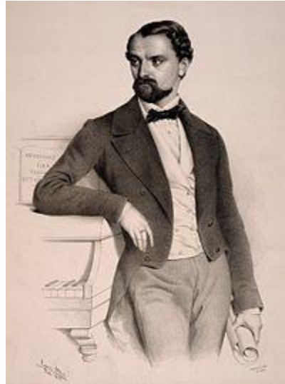
Canzi Ágost: Doppler Ferenc portréja 1853-ból (Wikipédia)

A Parlando olvasóinak – a műveket hanganyagukban is bemutató ez évi korábbi tisztelgésünk folytatásaként 2 – jeles kerek születésnapján ismét Doppler Ferenc német származású magyar fuvolaművészre, zeneszerzőre és karmesterre emlékezünk, aki 1821. október 16-án született Lembergben (Lwów, ma: Ukrajna) és 1883. július 26-án hunyt el a Bécs melletti Badenben. Ő is, mint családja többi tagja, idegenben született, idegenben halt meg, mégis egész élete, munkássága rengeteg szállal kötődött a magyar zenekultúrához. Doppler Ferenc – Liszt, Erkel, Mosonyi kortársaként – jellegzetes képviselője volt azoknak a 19. századi, magukat magyar érzelműnek valló muzikusoknak, akik jelentékeny