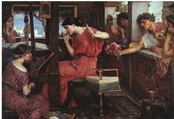
Pénélopé és a kérők

Nauszikában valami, amihez Odüsszeusz méltatlan, a törekenysége, a tisztasága, leginkább mégis az, hogy ezeket képes feltétel nélkül megosztania vele.