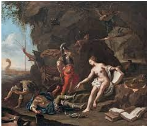
Miel, Jan (1599–1664): Kirké elvarázsolja Odüsszeusz társait

A darab cselekményét tekintve is töredékes: a görög mitológia egyik legszövevényesebb történetének csupán utolsó epizódját dolgozza fel, Odüsszeusz megérkezését otthonába, Itakha szigetére. A cselekmény fókuszában a címszereplő és feleségének, Pénélopénak egymásra találása, romlatlan, tiszta szerelmének újbóli fellángolása áll. Ezt azonban az eredeti, mitológiai szövegben a címszereplő hosszas bolyongása előzi meg jelentős nőalakok szerepeltetésével. Az örök szerelemmel, Pénélopéval együtt összesen négy, a férfi számára jelentős női karakter ábrázolódik az Odüsszeia cselekményében: négy eltérő görög portré, négy fekete-narancs ábra egy ókori vázán, négy lehetőség különböző archetípusok megértésére, a földi szerelemtől a kézzel, értelemmel alig megragadható ideálisig.