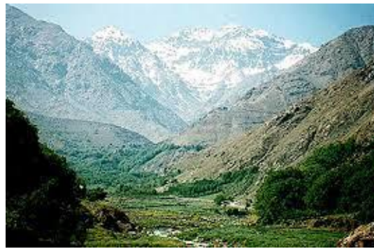
Atlasz hegység (koliver.wordpress.com)

A fenti kérdést – mi történik a leírt zene megszólalása és a hallgatóban létrejövő élmény közötti pillanatban – racionálisan is leírható, pl. hanghullámok vagy a fül anatómiájának leírásával. Csakhogy szükségünk van az érthető mellett a titokzatosra is, ezért gyakran többféle nézete is kínálkozik egy jelenségnek.