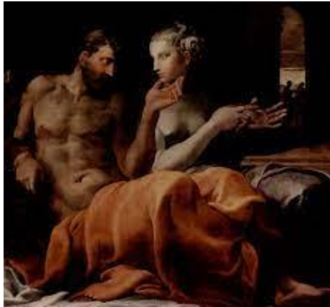
Francesco Primaticcio: Odüsszeusz és Pénélopé

Több egymástól eltérő hangszerelésben is hallható az 1640-ből származó opus, Monteverdi ugyanis kizárólag az énekszólamokat és a basszust, illetve a fontosabb hangszerszólamokat jegyezte le a hangszerek megnevezése nélkül, vagyis a darab később rekonstruálásra szorult, így a mai napig is vita tárgya, milyen hangszerek hangján képzelhette el az egyes szólamokat.