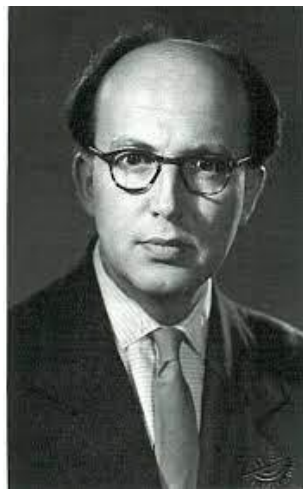
Maros Rudolf (1917–1982)