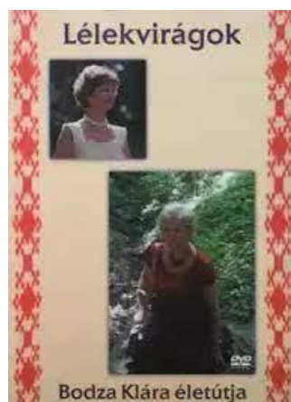
Szerkesztő: Bodza Klára, rendező: Sztanó Hédi (DVD-ETNOFON Records 2009)