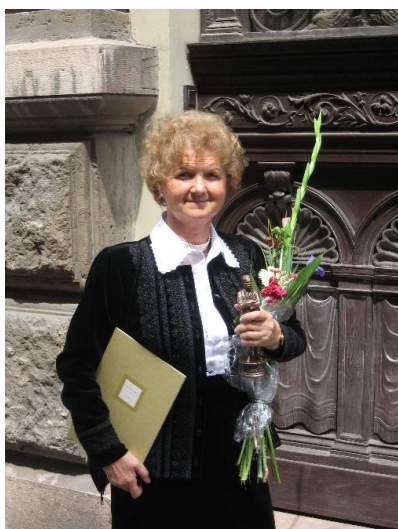
Az Eötvös József-díj átvétele után (2007)

Pro Cultura Újbuda – 2017. január; Martin György-díj – 2019. augusztus 20.