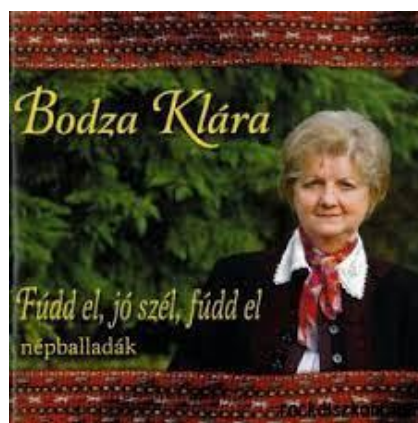
Szerkesztő: Bodza Klára, zenei rendező: Dióssy D. Ákos (CD-DIALEKTON NÉPZENEI KIADÓ 2011)