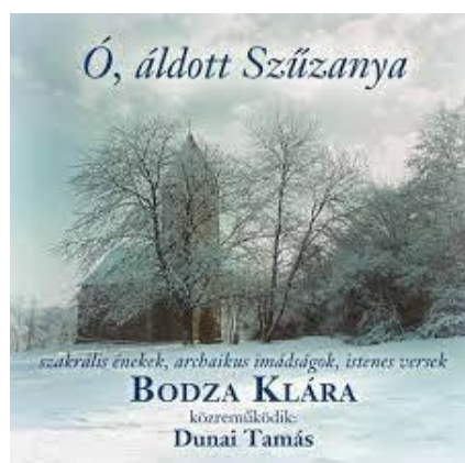
Szerkesztő: Bodza Klára, zenei rendező: Dióssy D. Ákos (CD-FONÓ Budai Zeneház 2014)