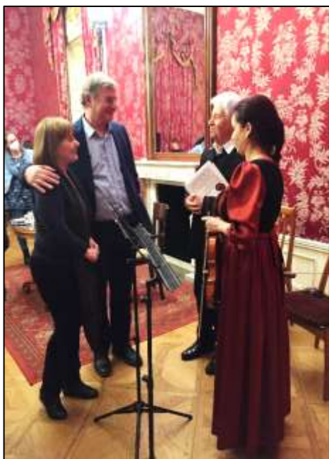
Könyvbemutató a PIM Lotz-termében