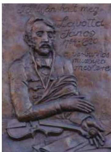
Kiss György domborműve

Lavotta a képzőművészetben is jelen van, igaz, a róla készült egyetlen festmény, 18 valamint számos 19. századi grafika szerzője – egy kivétellel 19 talán – a digitális archívumok 20 számára is ismeretlen.