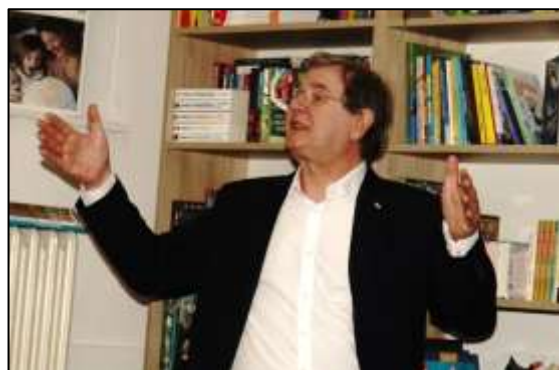
A sátoraljaújhelyi könyvbemutató képei