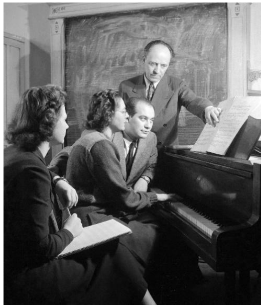
Bárdos Lajos a a zenetudományi tanszék növendékeinek tart órát az egykori Liszt Ferenc Zeneművészeti Főiskolán (2000-tól egyetem) Fotó: MTI /Magyar Fotó/Zinner Erzsébet, 1955)

BA: Arra pontosan nem emlékeztem, hogy ő volt a karnagy, mert még fiatalon nem ismertem jól a karnagyokat. Édesapám temetésén nagyon-nagy tömeg volt, sokan szerették őt.