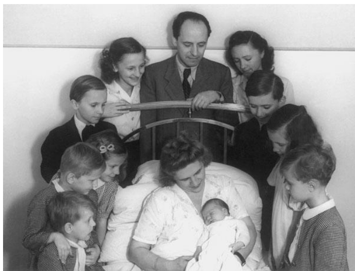
Megérkezett a 10. gyermek is

B. Á.: Azt csak úgy fiatalon, később már csak nagyobb séták maradtak, mert a szíve sokat rosszalkodott. Anyunak is rossz volt a szíve, úgy vállalt 13 szülést. Nagyon hősieesen viselték ezt a szívbetegséget mindketten. Apunak csak vezénylés közben jött elő, de édesanyámnak sokszor volt baja a szívével. Azonban fiatalon nagyon aktívan síeltek és úsztak, volt, hogy a Dobogókőről, futólécekkal le tudtak csúszni egészen Budapestig, mert annyi hó volt régen. Édesapám nagy cserkészvezető is volt, kirándulásokat szervezett.