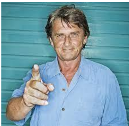
Michael Gordon Oldfield (Született: 1953. május 15.) brit zenész, dalszerző és producer

Mike Oldfield: The Songs of Distant Earth (A távoli Föld dalai)