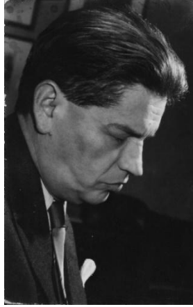
Ungár Imre (1909–1972)