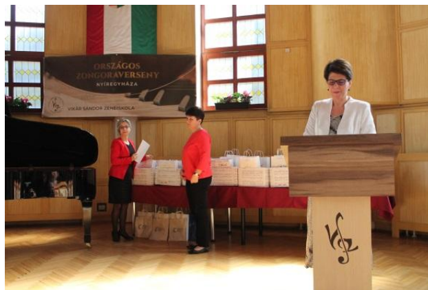
A díjkiosztó ünnepély pillanatai

A helyezettek és különdíjasok az oklevelek mellett támogatóink segítségével többek között kottacsomagot, ajándékcsomagot, vásárlási utalványt, könyveket, CD és DVD lemezt, belépőjegyeket, valamint egy nagyobb értékű sztereó fejhallgatót és zongoraszéket, a Veroszta Magda díjasok ösztöndíjat kaptak ajándékba. Valamennyi versenyző a Zenekultúra Támogatásáért Alapítvány és további támogatók ajándékát vehette át ideérkezésekor. A verseny ideje alatt igyekeztünk vendégeink számára folyamatos és tartalmas vendéglátást biztosítani, ezen kívül a támogatásoknak köszönhetően intézményünk frissített arculattal várta a verseny résztvevőit.