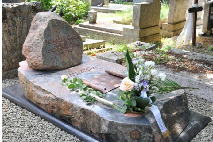
Balassa Sándor sírköve