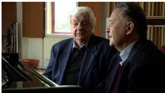
Balassa Sándor -- Dal a Sümegyvár utcából (5:13)

VÁLOGATÁS Balassa Sándor YOUTUBE-N TALÁLHATÓ FELVÉTELEIBŐL: