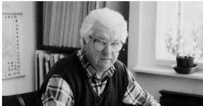
Balassa Sándor

Balassa Sándor, a Zeneakadémia egykori oktatója 86 évesen hunyt el 2021. május 14-én. Első intenzív zenei tanulmányait a budapesti Bartók Béla Zeneművészeti Szakközépiskolában végezte karvezető előkészítő szakos hallgatóként, majd 1960-tól 1965-ig Szervánszky Endre zeneszerzés növendéke volt a Zeneakadémián. Már diákként a Magyar Rádió alkalmazásába lépett, ahol mintegy két évtizeden át zenei rendező volt. 1981 és 1995 között a Zeneakadémián hangszerelést tanított a zeneszerző növendékeknek. Munkásságának elismerését számos kitüntetés jelzi: 1972-ben Erkel Ferenc-díjat, 1978-ban érdemes művész kitüntetést, 1983-ban Kossuth-díjat, 1988-ban és 1998-ban Bartók Béla–Pásztory Ditta-díjat, 1989-ben a kiváló művész kitüntetést, 2012-ben a Magyar Érdemrend középkeresztjét vehette át, 2014-ben pedig a Nemzet Művésze kitüntető címet adományozták neki.