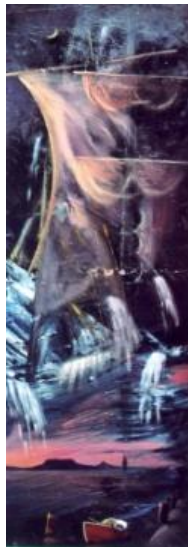
A SZENT VÍZ olaj-fatábla, 70m5 x 25 cm, 2005.

Pink Floyd: Signs of life (Életjelek) – 4:23