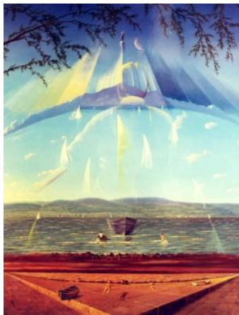
TANULUNK REPÜLNI olaj-fatábla, 165 x 130 cm, 2000.

https://www.youtube.com/watch?v=9s4JU5gJ1zQ