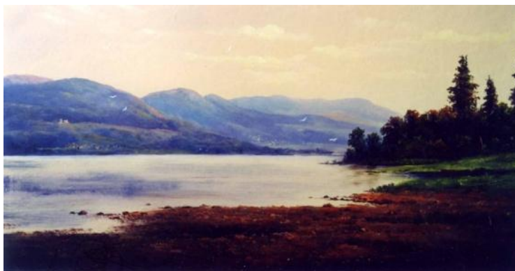
NAGYMAROSI DUNA olaj-fatábla, 30 x 60 cm, 2003.

https://www.youtube.com/watch?v=hBPUundF1dA