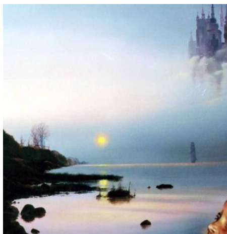
MESE olaj-fatábla, 50 x 50 cm, 2005.

https://www.youtube.com/watch?v=c2Bdsr7CwBI (5:33)