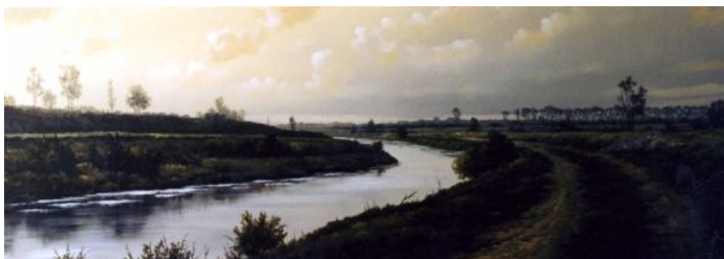
KANYARGÓ SIÓ olaj-fatábla, 40 x 110 cm, 2002.

Queen: Seven seas of rhye ( Hét tenger )