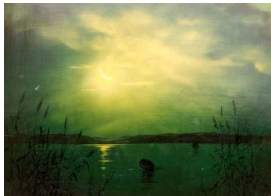
LAGÚNA olaj-fatábla, 65 x 85 cm, 1991. https://www.youtube.com/watch?v=4LVUHNegZel (2:56) Black Sabbath: Laguna sunrise ( Napkeltelagúna )