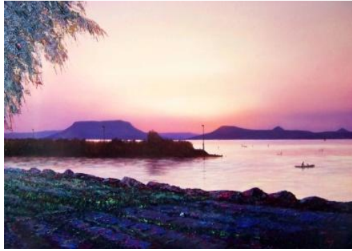
A TÓ olaj-fatábla, 50 x 70 cm, 2012.

https://www.youtube.com/watch?v=44d0TF_XcFs