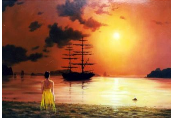
ROMANTIKUS TENGERI KÉP olaj-fatábla, 70 x 100 cm, 1999. https://www.youtube.com/watch?v=FOCucJw7iT8&t=300s (23:08) Debussy: La Meer ( A Tenger ) – 23:08