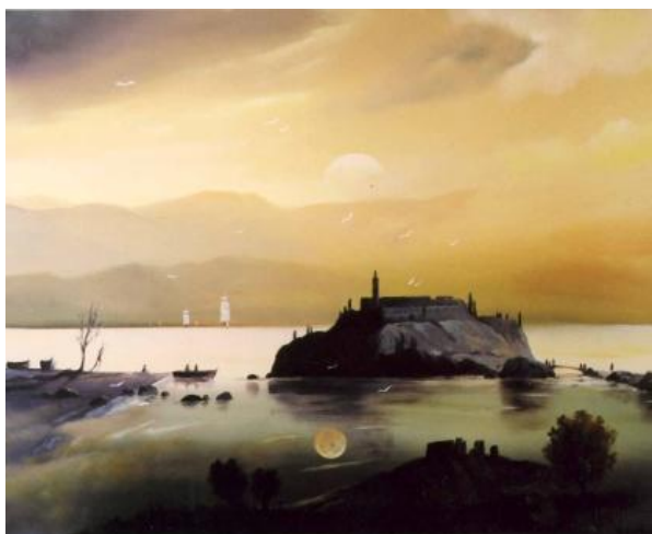
A SZIGET olaj-farost, 50 x 70 cm, 2006.

https://www.youtube.com/watch?v=rUJ-KPCKWDs&list=PL-QSKXRtHSmsxCRWOGHZIWsa8v8iJw2tD&index=6