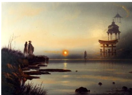
ÚT olaj-fatábla, 50 x 70 cm, 2002. https://www.youtube.com/watch?v=KI8b6GO5C80&t=1s Eloy: Ocean ( Óceán ) – 44:11