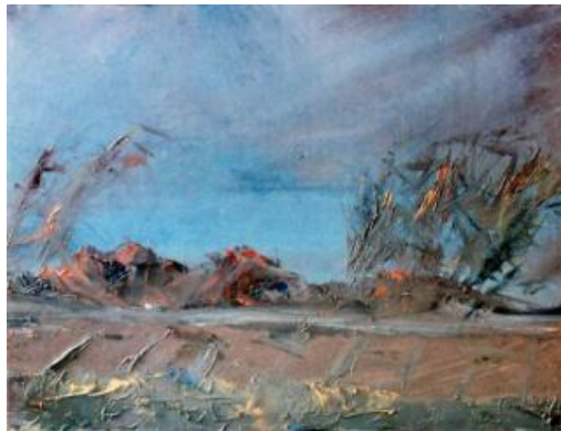
NYÁRI ESŐ olaj-farost, 22,6 x 30 cm, 2005. https://www.youtube.com/watch?v=AsOit4_aPWQ Timo Iainé/Symphonic Slam: Sommer rain ( Nyári eső ) – 3:53