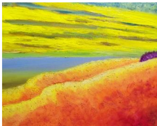
LOVE BEACH olaj-vászon, 40 x 50 cm, 2015. https://www.youtube.com/watch?v=-cM1ab-i4h4 Emerson Lake & Palmer: Love beach ( Szerelmi tengerpart ) – 2:46