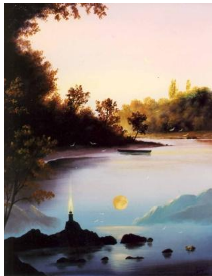
A FOLYÓ FÉNYE olaj-farost, 70 x 50 cm, 2006. https://www.youtube.com/watch?v=3G4NKzmfC-Q (13:14) (Smetana: Moldva)