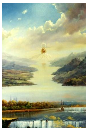
A NAGY FOLYÓ olaj-fatábla, 70 x 50 cm, 0992. https://www.youtube.com/watch?v=3TJnGOAvajs Omega: Nagy folyó – 3:3