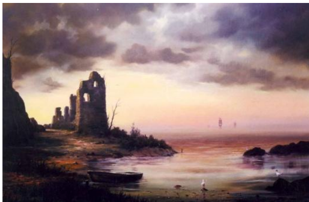
HAJNALI ÓCEÁN – Romantikus tengeri kép olaj-fatábla, 60 x 90 cm, 1999.

https://www.youtube.com/watch?v=M4jBir34guQ (7:00)