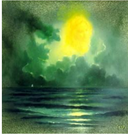
SOHA NE MENJ EL olaj-gránit, 30 x 30 cm, 2001. https://www.youtube.com/watch?v=ojf18wT_Xtk Pink Floyd: No more turning away ( Többé ne forduljon elő ) – 5:42