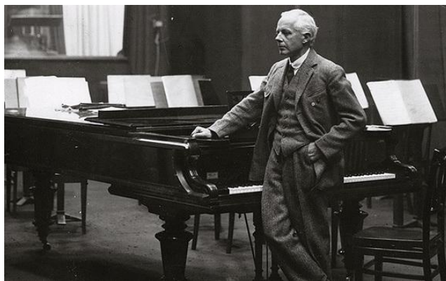
Bartók a Magyar Rádió Stúdiójában

Bartók negyvenötödik születésnapja előtt néhány héttel: 1926. március 3-án zongorázott először a budapesti rádióban; ez volt egyszerismind életének első rádiószereplése. Ezt aztán meglehetősen sok rádiókoncert követte, valamennyit ma sem ismerjük még. A zeneszerző idősebbik fia, Béla, apjának hatvannál több budapesti rádiószereplését mutatta ki; ez a szám, a külföldi rádiókoncertekkel együtt, jócskán meghaladja a százat. De nem tudjuk még pontosan, hogy nyilvános hangversenyei közül mennyit közvetített a rádió; azt sem, hogy „élő” rádiókoncertjei mellett hány ismétlés hangzott el viaszlemezről. Budapest mellett egyébként London, Stuttgart, München, Koppenhága, Königsberg, Berlin, Bécs, Frankfurt, Zürich, Bukarest, Stockholm, Birmingham, Nürnberg, Brüsszel, Luxemburg, Párizs és New York rádióállomásai adtak teret a zongoraművész és népzene kutató Bartóknak.