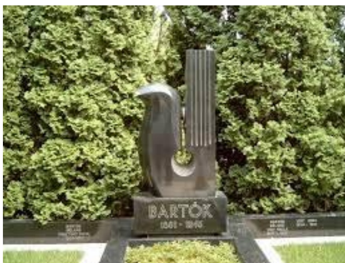
Borsos Miklós: Bartók Béla és családjának síremléke a Farkasréti temetőben (1988. VII.7.) A Farkasréti temető 60/1-es parcellájában Főút-9/12-es sírhely. (Bartók Béla síremléke – Köztérkép)

Forog a korong: nem tudom hányadszor a Cantata profanát hallgatom. Kolindából kiszakadó drámai meloszát, amelynek néhány dallamfoszlányát szülőföldemen Erdélyben hordta a szél valamikor. Az emberi hang – Bartók hangja – belső hallásra nyitja a fület. Forog a korong: Cantata profanát hallgatom. A démoni hatalmak fojtogató szorításában vergődő ember tragikumát és tehetetlen átváltozásait, a bűnhődés és a büntetés sajkásait oldó természet-hit