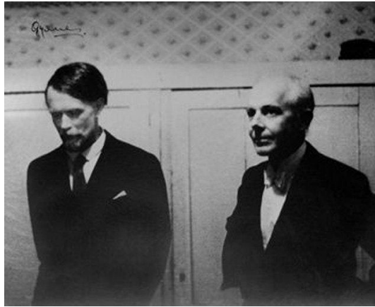
Kodály Zoltán és Bartók Béla 1930-ban

Bartók abból az emberfajtából való, amely örök elégedetlenségtől hajtva, mindent meg akar változtatni, mindent szebbé-jobbá akar tenni, amit csak a Földön talál. Ebből kerülnek ki a művészet, a tudomány nagyjai, a nagy felfedezők, feltalálók, politikában a nagy forradalmárok, Columbusok, Galileik, Kossuthok, akik másképp hagyták maguk után a világot, mint ahogy találták.