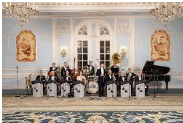
Savoy Orpheans

-Amikor mi két évvel ezelőtt összeállítottuk a Savoy Orpheanst, nem kevesebb, mint 8600 darabot próbáltunk végig, amíg végre össze tudtuk válogatni azt a 200-at, ami a műsorunk alapja volt. Hónapokig tartó utánjárással, mondhatnám a világ minden részéből kutattuk fel azt a 16 legjobbnak tartott jazzistát, akik közül azután négy hónapi próba után kiválogattuk azt a tizenkettőt, akikből ma a világ legjobb jazz-bandje áll. Mert én bátran állíthatom, hogy mint együttes, felülmúlja még Whiteman híres amerikai zenekarát is. Látva Somers úr boldog dicsekvését, kedvezőnek láttam az alkalmat megkérdezni, mi az igazság azokban a valósággal fantasztikusnak tetsző híresztelésekbe, amelyek a Savoy-band óriási jövedelmeiről elterjedtek