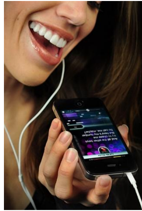
Online énektanulás bárhol, bármikor

A digitalizáció napjainkban kulcsfontosságúvá vált az élet minden területén és minden iparági szegmensben, köztük a zene világában is. Jelen cikk – sorozatunk tizenkettedik részeként - olyan applikációkat mutat be, amelyek elősegítik a zenetanulást az online térben – az énekoktatásra fókuszálva. Hangsúlyozzuk, hogy ezek az alkalmazások természetesen nem helyettesítik a személyes kapcsolatot és a tanár személyét, azonban meghozhatják a fiatalok kedvét a klasszikus zenéhez és a zenetanuláshoz, illetve hatékonyabbá tehetik az otthoni gyakorlást - kiegészítve a tanár munkáját.