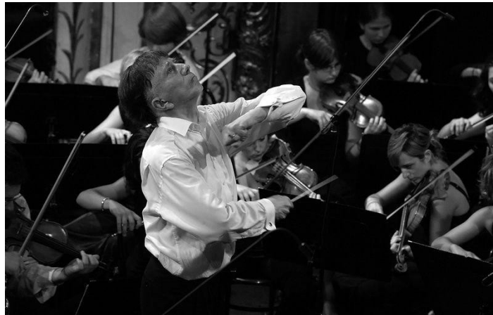
Vásáry Tamás a Magyar Rádió Szimfonikus Zenekarát vezényli.

hazajárt koncertezni, mesterkurzust vezetni, sőt feleségével itt szándékoztak letelepedni is. Az erre invitáló szó azonban nem hangzott el, csak húsz évvel később – akkor viszont egy egész testület mondta ki. Magam is ott voltam a Budapest Kongresszusi Központban azon a Rádiózenekar élén adott hangversenyén, melynek hőfokától felizzott a terem: a közönség tombolt, a muzsikusok pedig ott helyben petíciót írtak alá, hogy Vásáry karmester urat megnyerhessék maguknak tartós együttműködésre.