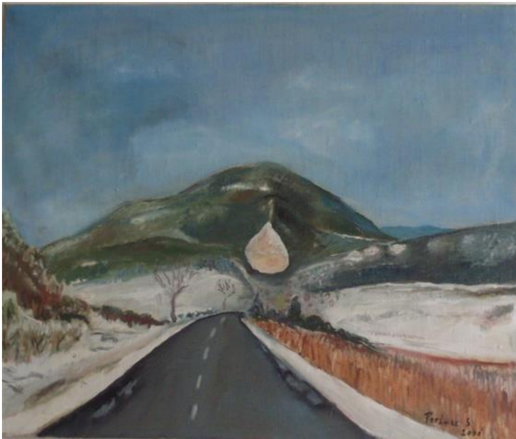
A téli pilisi hely (2000) vászon, olaj