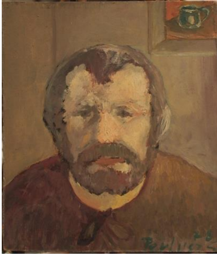
Önarckép (1979) farost, olaj