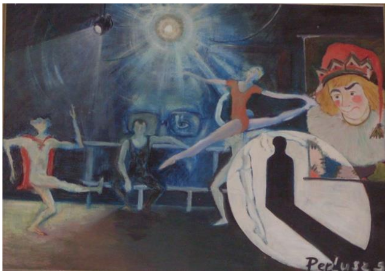
Önarckép farost, olaj