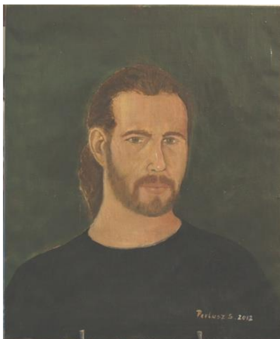
Dávid unokám (2012) vászon, olaj