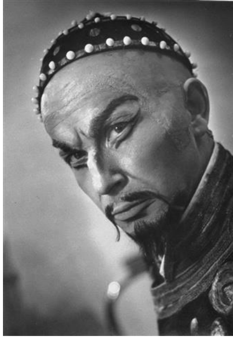
Bahcsiszeráji szökőkút: Nurali tatárvezér