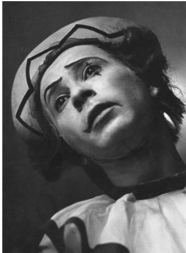
Petruska: címszerep (1966)