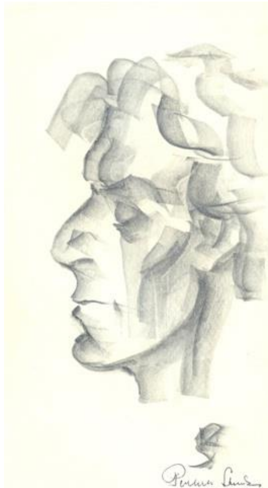
Róna Viktor (1969) Párizs, ceruza, grafika