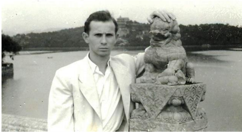
Egy kép Kínából

Nádasi Ferenc növendékeként 1957-ben diplomáztam, és ekkor szerződtem a Magyar Állami Operaházhoz. Már az első évben kisebb szóló szerepeket kaptam, de első jelentős nagy szerepemet az 1957-58-s évadban kaptam a Giselle-ben, majd 1958-59-ben Bartók-Harangozó Fából faragott királyfi címszerepét is eltáncolhattam. Ez a szerepem egész pályámon végig kísért, mert idehaza és külföldön több mint száz alkalommal táncoltam el Európa szinte valamennyi jelentős Operaházában. 1958 őszén neves művészekből álló csoporttal meghívást kaptam Kínába egy koncert turnéra, 1959 tavaszán a Hacsaturján Gajane című balettjének egyik főszerepét is eltáncoltam, továbbá 1959 nyarán a bécsi Világ Ifjúsági Találkozó balett versenyén első díjat nyertem. Ez év október 1-én Kína nemzeti ünnepén Csu enlaj miniszterelnök adományozta barátsági emlékérmét vehettem át.