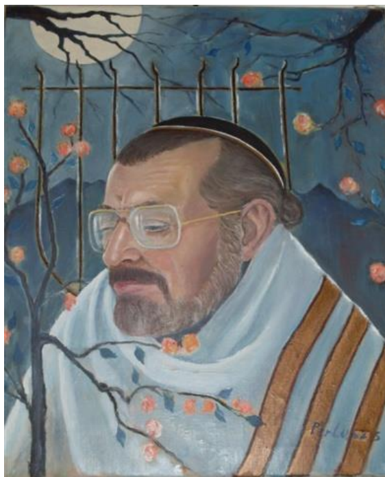
Rabbi (1999) vászon, olaj