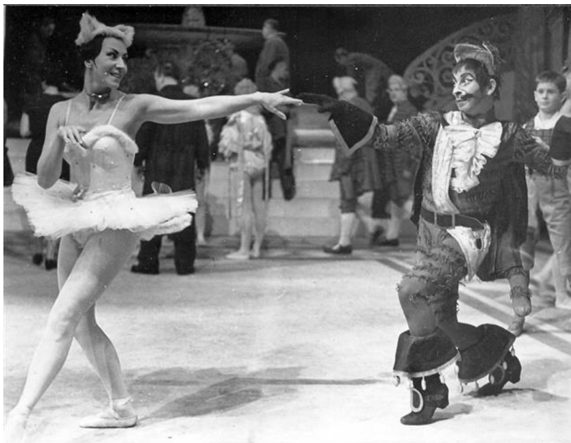
Csipkerózsika: Cica kandúr duett