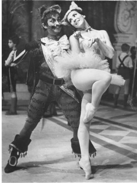
Csipkerózsika: Cica kandúr duett