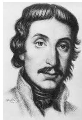
Csokonai Vitéz Mihály