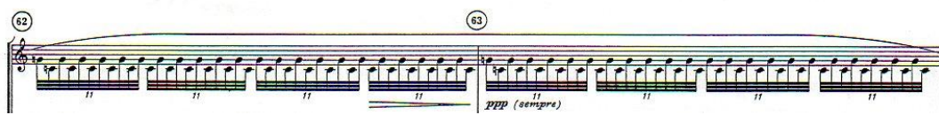
Kottapélda. Ligeti: II. vonósnégyes 5. tétel 62-63. ütem.

Az első tétel 80 ütemnyi zenéjének – a váltakozó ütemmutatók ellenére állandó – alapsebességét a szólóhegedű tizenhatodmozgása adja meg. Négy ütem kivételével (34-37. ütem) \text{♩} = 60 a tempó. Bár a tétel középrészében a karmester nagy négyben adott alappulzálása gyorsabb lesz, a tizenhatodok sebessége változatlan marad ( \text{♩} = 80 ). A tételt beúsztató üreshúros kvint-tremoló – vagy saját szavaimmal hangköztrilla – a II. vonósnégyes emlékének mélységéből neszezik: ott az 5. tétel 62. ütemében érkeznek meg a különböző hangköztrillák a kvintre.