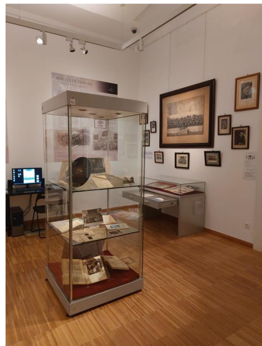
Részletfotók a kiállításból