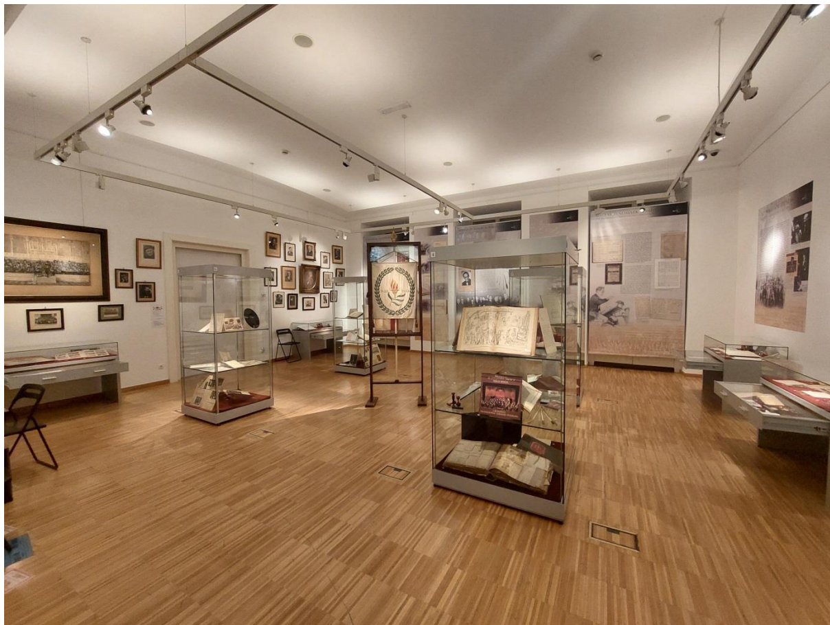
A Pillanatképek egy zenekar történetéből című kiállítás a Zenetörténeti Múzeum 1. termében

Tekintve, hogy a zenekar koncertéletről, elnök- és vendégkarnagyairól, korábbi jubileumairól már számtalan kiváló publikáció készült, illetve a közelmúltban egy friss zenetörténeti reflektálás is napvilágot látott az Együttes 170 évéről ennek a katalógusnak a nyomán, jelen könyvismertetés a katalógus és kiállítás összehasonlítása felől közelíti meg a témakört. 3