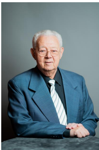
fotó: Berez Valter (Budapest, 1944. július 6.) Liszt Ferenc-díjas operaénekes, kiváló művész.