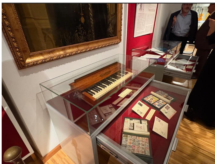
Második és első tárló