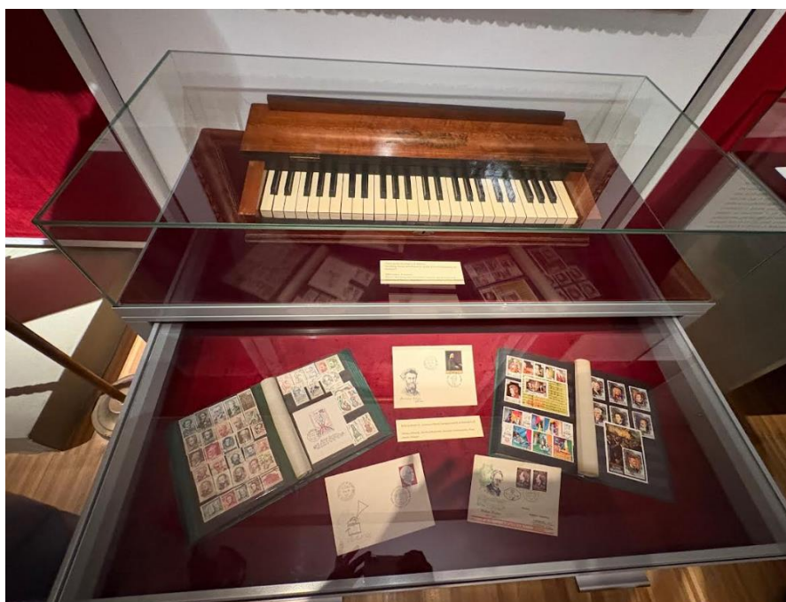
Goldmark Károly négykezesek. Köszönőlevél és fénykép Ferenc pápától