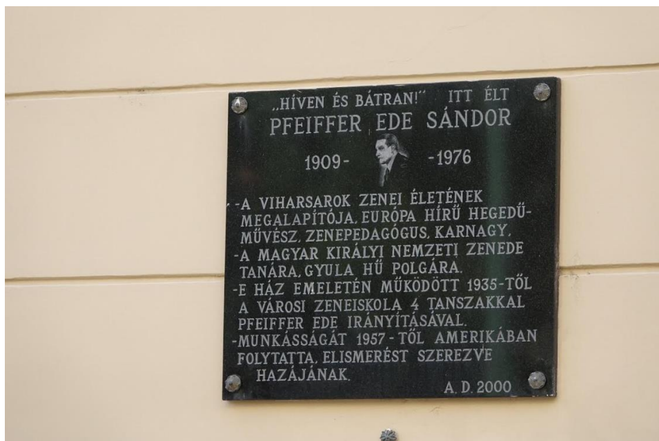
Pfeiffer Ede Sándor emléktáblája