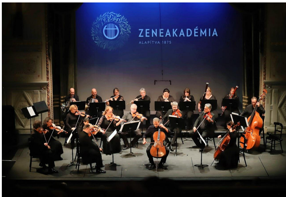
A Budapesti Filharmóniai Társaság Kamarazenekara A mi Erkelünk c. dokumentumfilm zeneakadémiai premierjén