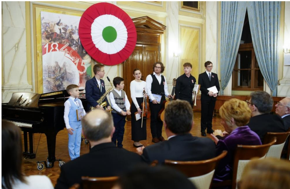
Gyulai Tehetségek az Erkel Ferenc Társaság XXXIV. Történelmi Hangversenyén (Fotó Rusznyák Csaba)