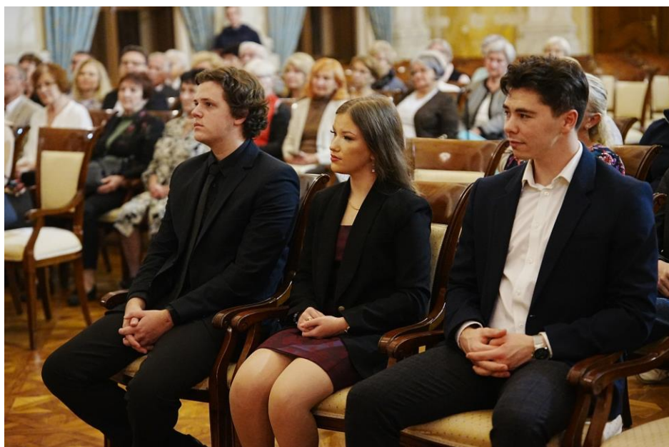
A 2025-ös esztendő Erkel ösztöndíjasai