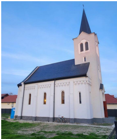
A felújított a nagyszentmiklósi református templom.