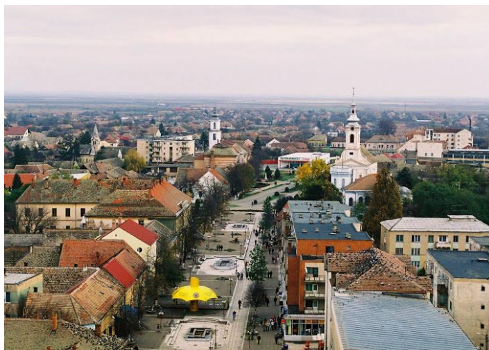
Nagyszentmiklós (Sânnicolau Mare) napjainkban