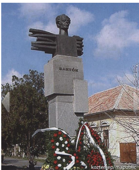
Jecza Péter: Bartók (gránit, bronz, 1993, Nagyszentmiklós). Forrás: https://www.kozterkep.hu/36044/bartok-bela-emlekmu