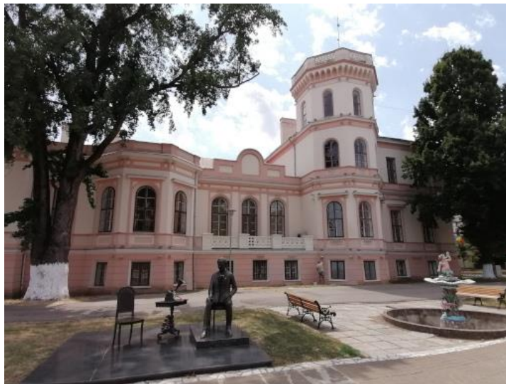
A nagyszentmiklósi Nákó-kastély napjainkban, előtte a 2015-ben felállított Bartók szobor