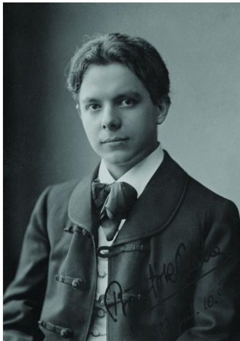
Bartók Béla 1903-ban