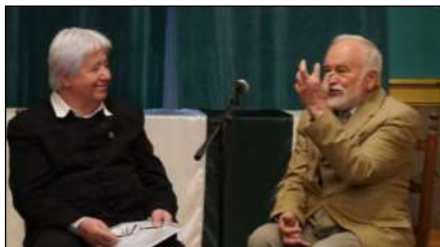
Zenés beszélgetés a konferencia díszvendégével...

Azonban a szervezők nem estek kétségbe s hamar méltó díszvendéget találtak a