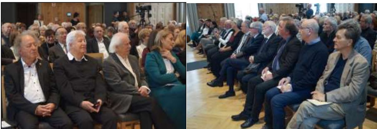
Díjazottak az első sorban

Alig hihető, hogy a felsorolás teljes lesz valaha is, hiszen az ebből a névsorból még igen csak hiányzó, a Magyar Örökség díjra szintén érdemesek közül a fentiek többszörösét is meg