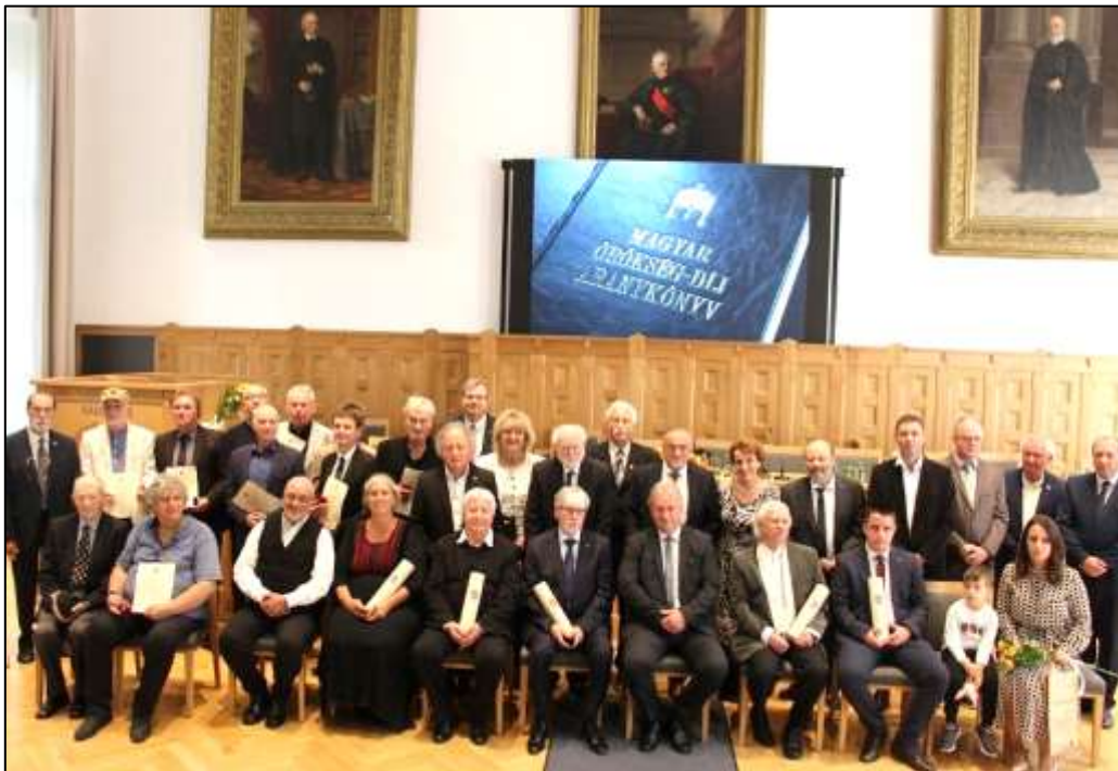
Díjazottak a laudátorokkal