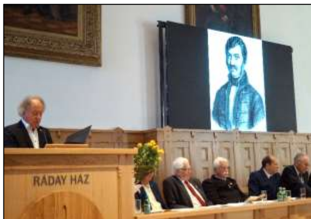
Szecsődi Ferenc laudációja

Lavotta- és a verbunkos-zene iránti tudományos érdeklődés fenntartására 1990-től – elsősorban minden kerek születési, valamint halálozási évforduló emlékére – Sátoraljaújhelyen,