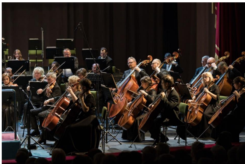
A Szegedi Szimfonikus Zenekar gordonka és gordon szólama