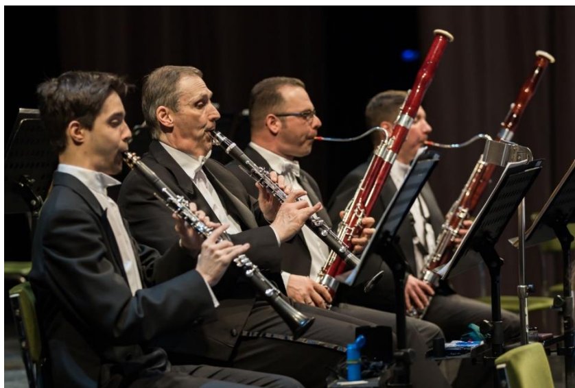
A Szegedi Szimfonikus Zenekar klarinét és fagott szólama