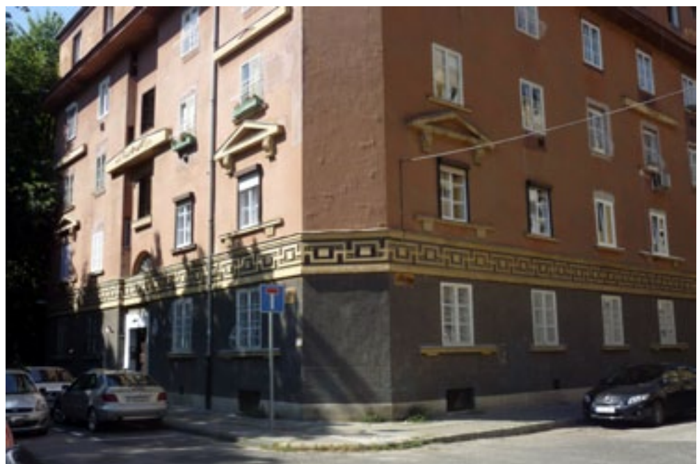
A LEGENDÁS NAGYSZOMBAT UTCA