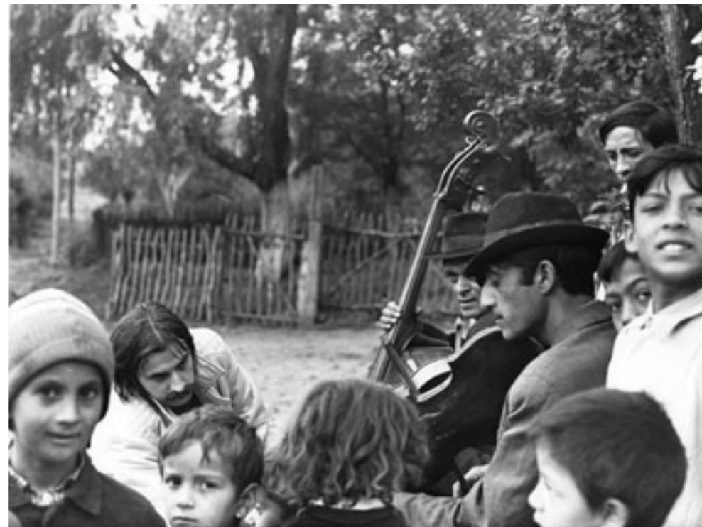
KOBZOS KISS TAMÁS GYŰJTÉS KÖZBEN A MAGYARORSZÁVI CIGÁNYOKNÁL 1974-BEN

A népzene rendszeres, zeneiskolai keretek között történő tanítása