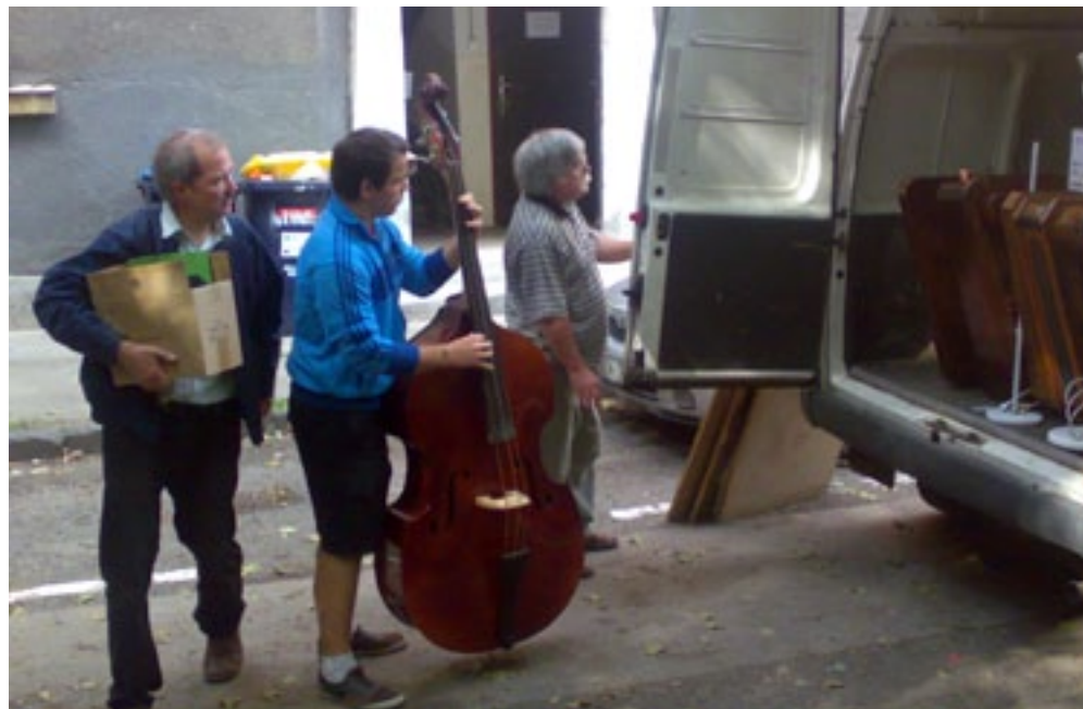
KÖLTÖZÉS A NAGYSZOMBAT UTCÁBÓL