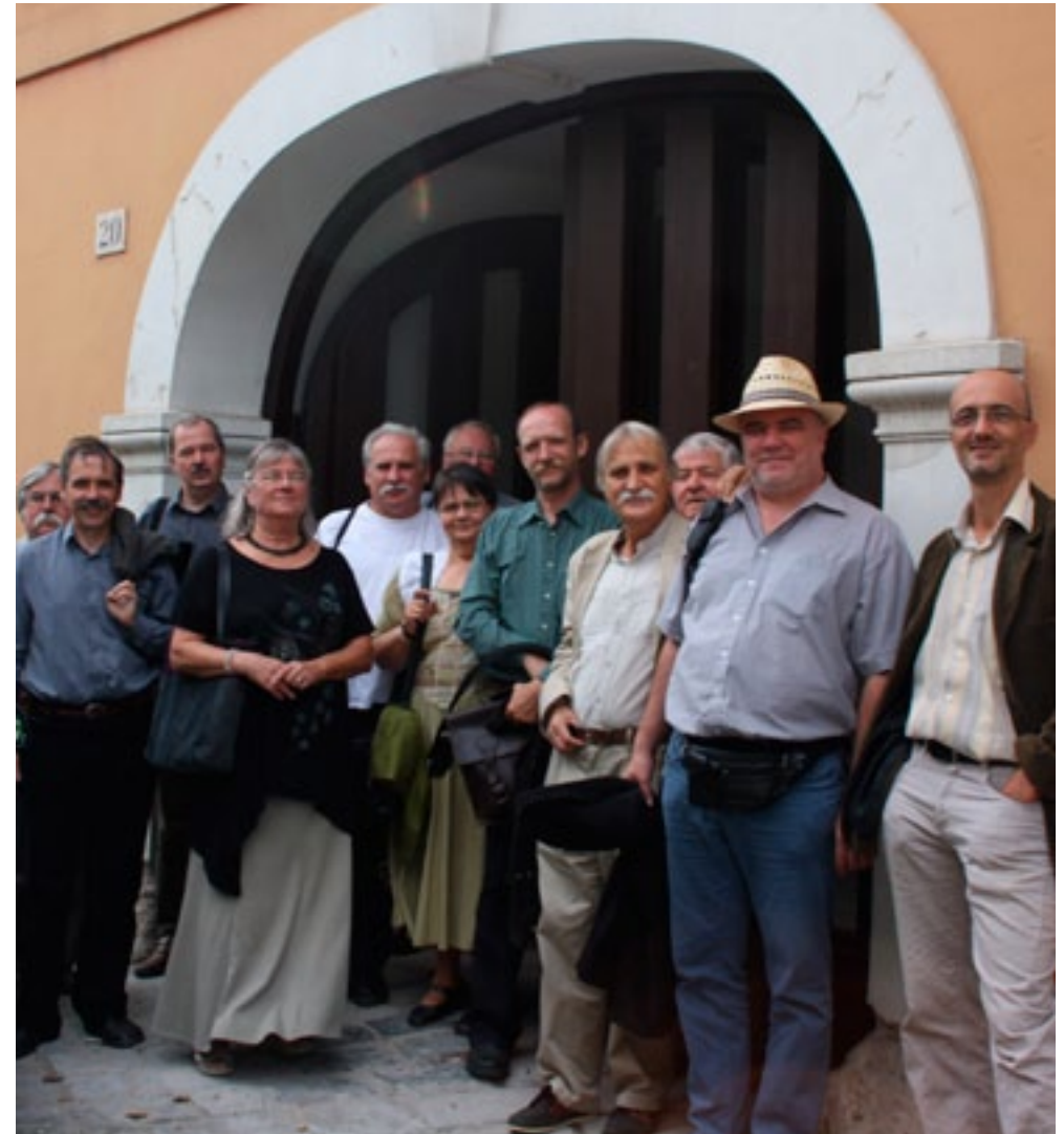
AZ ÚJ ISKOLA ÉPÜLETE ELŐTT, A TANÁRI KARRAL